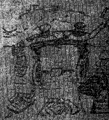
Prusacy chcą zwyciężyć przy plebiscyfie na Górnym Śląsku Na wstępie trzeba walczyć do końca. Prusacy chcą zwyciężyć przy plebiscyfie