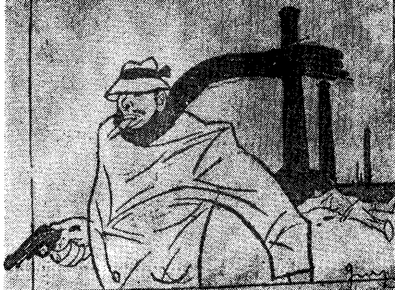
„Stosstrupp“: Nie mogę powiększyć głosu niemieckich (...), ale mogę za to zmniejszyć głosy polskie — rewolwerem!

„Stosstrupp“: Nie mogę powiększyć głosów niemieckich (...), ale mogę za to zmniejszyć głosy polskie — rewolwerem!”