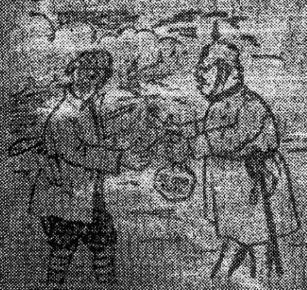
Prusacy chcą zwyciężyć przy plebiscyfie na Górnym Śląsku Na wstępie trzeba walczyć do końca. Prusacy chcą zwyciężyć przy plebiscyfie

Jakimi środkami chcą Prusacy zwyciężyć przy plebiscyfie na Górnym Śląsku Na wstępie trzeba walczyć do końca. Prusacy chcą zwyciężyć przy plebiscyfie